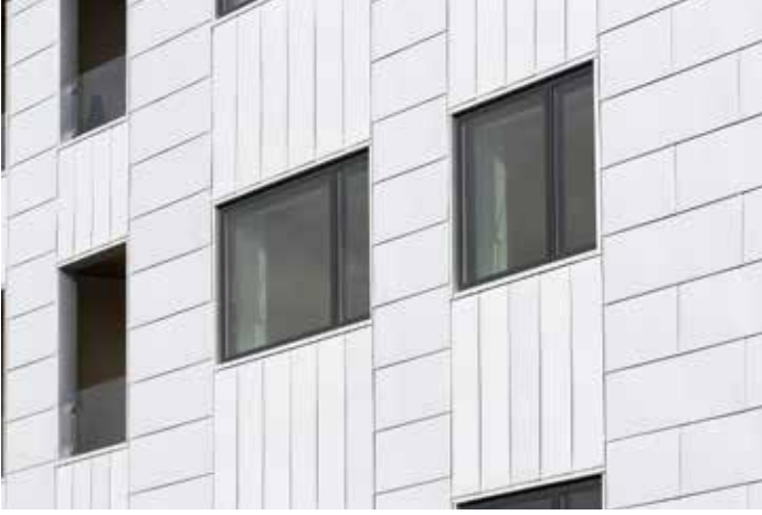
Tüm bina form ve tipleri