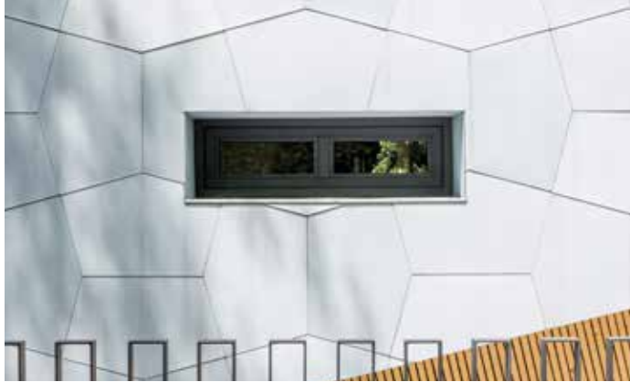
İç mimari, dekoratif kaplamalar