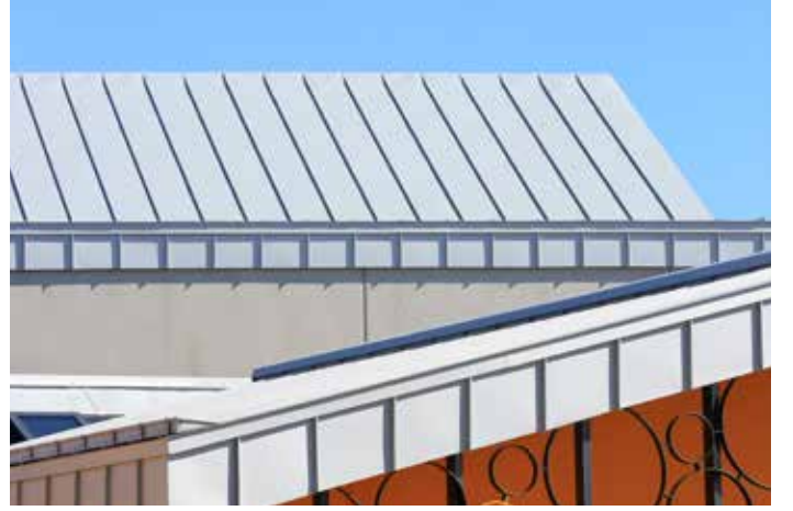
% 5 ve üzeri tüm çatı ve cepheler