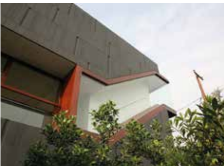
ANTHRA-ZINC® antrasit siyah