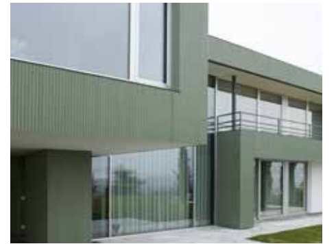
PIGMENTO® yosun yeşil