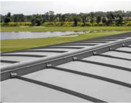
QUARTZ-ZINC® füme gri