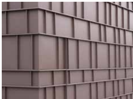
PIGMENTO® toprak kırmızı