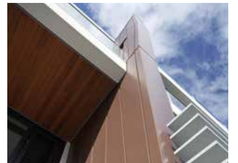
PIGMENTO® ağaç kabuğu