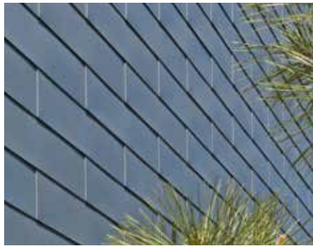
PIGMENTO® kül mavi