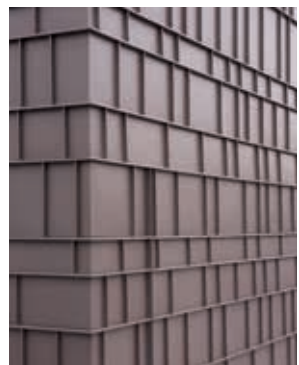
PIGMENTO® ağaç kabuğu