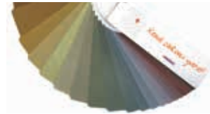
PIGMENTO® kül mavi